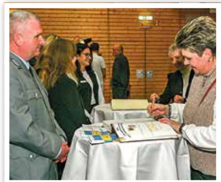
Viele Besucher trugen sich in die Gästebücher von Stadt und Bundeswehr ein.