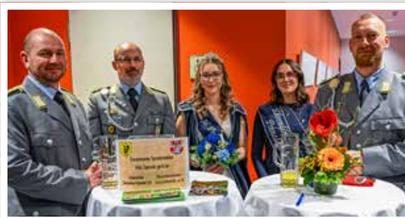
Die Schwanenkönigin und ihre Ehrendame warben gemeinsam mit den Fernmeldern beim Neujahrsempfang für den guten Zweck zu Spenden. 3.560 Euro kamen zusammen. Das Geld wird demnächst offiziell übergeben.

Das Naturerlebnis Uckermark – vielen auch noch als „Ökostation“ ein Begriff – ist ein Familienfreizeitangebot in Prenzlau, das weit über die Grenzen der Uckermark-Kreisstadt hinaus kleine und große Gäste anzieht. Der Familienpark mit seinen mehr als 250 Haustieren ist ein Besuchermagnet. Auf 12 Hektar Fläche gibt es hier eine einzigartig gestaltete Naturlandschaft mit zahlreichen Erlebnisbereichen. Zu denen gehört unter anderem die Schäumkerei, die vom Imkerverein Schmöln betrieben wird. Neben den Haustieren – von verschiedenen Papageienarten über diverse Hühnerrassen bis hin zu Schwein-, Schaf- und Ziegenrassen, befinden sich auch bedrohte Rassen wie die Waliser Schwarznasenschafe, Bretonische Zwergschafe oder auch Thüringer Waldziegen. Darüber hinaus gibt es ca. 15 verschiedene Geflügelrassen, die von Pommerschen Gänsen und Vorwerkhühnern über amerikanische Gersey Giant